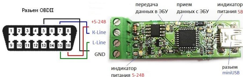
Общий вид устройства и его подключение

Предлагаемый блок представляет собой простой и надежный универсальный адаптер К/Л-линии. Устройство предназначено для подключения персонального компьютера (PC) к диагностическому каналу (К или L -линии) электронного блока управления (ЭБУ) автомобиля для диагностики и управления его функциями. Оно представляет собой преобразователь уровней логических сигналов обмена ЭБУ и стандартного порта USB. Драйвер К-линии полностью защищен от случайного замыкания на корпус и перегрева. Устройство подходит для ЧИП - тонинга автомобиля.